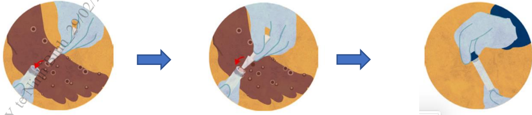
Hình ảnh minh họa về lấy mẫu da/vảy khô từ vết tổn thương

thương): sử dụng panh kẹp hoặc dụng cụ gấp (có đầu không sắc) vô trùng để gấp toàn bộ hay một phần da/vảy khô (kích thước ít nhất 4mmx4mm) rồi cho vào ống vô trùng (ống 1,5ml hoặc ống 5ml) không chứa môi trường vận chuyển. Sử dụng băng cá nhân để băng lại vết thương sau khi lấy mẫu.