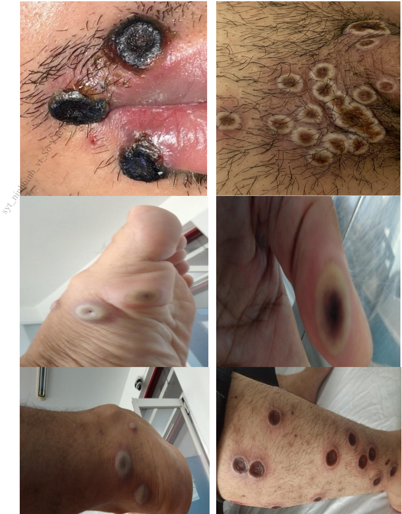
Hình 2. Hình ảnh tổn thương sâu